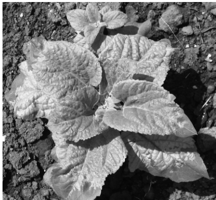
Sl.1. Biljka zaražena primarnom infekcijom (originalni snimak) Fig.1. Susceptible plant with symptoms of primary infection (original picture)

Prvi simptomi su uočljivi na kotiledonim listićima i prvom paru listova. Na naličju lista se obrazuje bela navlaka micelije sa konidioforama i konidijama. Na slici 1. prikazana je zaražena biljka u fazi pet pari listova, sa tipičnim hlorotičnim promenama.