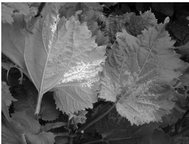
Sl.2. Sekundarna zaraza – simptomi na listu i bela navlaka na naličju lista (originalni snimak)

Sekundarne zaraze su u vidu hlorotičnih žuto-zelenih pega na licu lista. U okviru pega, sa naličja listova se obrazuje bela navlaka, sastavljena od konidiofora i konidija gljive (Sl. 2). Pege se spajaju i mogu da zahvate veće površine lista. Lokalne zaraze ponekad prelaze i u sistemične (Lačok, 2008 b).