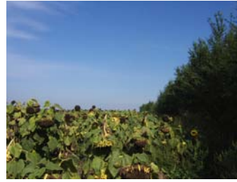
b) pre ubiranja b) before harvesting