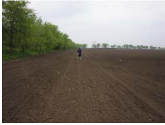
a) posle setve a) after sowing