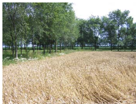
Slika 1. Posmatrana parcela posle setve (levo) i pre ubiranja (desno) Figure 1. Observed field after sowing (left) and before harvesting (right)