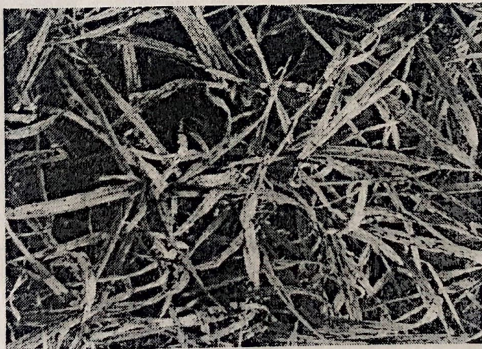
Sl. 2. Simptomi pegavosti i propadanje samoniklih biljaka ječma (Orig)

Problemi vezani za setvu nedeklarisanog semena se uvećavaju, jer i pored svih upozorenja, u 1998. godini nedeklarisanim semenom zasejano je oko 50% površina. Mnogi nisu predali pšenicu zbog prisustva glavnice ( Tilletia spp.). O ovom problemu dosta je pisano i