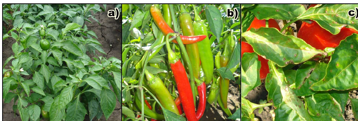
Slika 2. a) ECW-20R (inokulisana biljka) avgust 2014. god. b) Linija 30 (inokulisana biljka) septembar 2014. god. c) Kalifornijsko čudo (inokulisana biljka) septembar 2014. god. (foto: Danojević, D.)

Umereno osetljive (medijana 4) su bile biljke sorte Kalifornijsko čudo (Slika 2) i F2 generacija kombinacije (PB x ECW-20R).