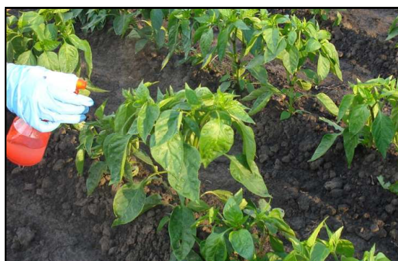
Slika 1. Inokulacija biljaka paprike sa X. euvesicatoria u poljskim uslovima

Oplemenjivački program je započet 2013. godine, kada su tri linije slatke paprike u tipu babure (B), polubabure (PB) i kapije (K) Instituta za ratarstvo i povrtarstvo, Novi Sad, ukrštene sa linijom ECW-20R koja je nosilac gena otpornosti Bs2 na BP. Nakon ukrštanja, tri hibridne kombinacije (B x ECW-20R, PB x ECW-20R i K x ECW-20R) su posejane u oktobru 2013. godine u stakleniku, da bi se tokom zimskog perioda dobilo seme F2 generacije. Dobijeno F2 seme, ECW-20R, sorta Kalifornijsko čudo i linija 30 je posejano početkom aprila 2014. godine u plasteniku, a biljke su rasađene početkom juna na otvoreno polje Instituta za ratarstvo i povrtarstvo, Novi Sad. Linija 30 je na lokalitetu Rimski Šančevi ispoljila otpornost na BP tokom 2012. godine i nepoznatog je porekla. Razmak između biljaka je bio 70 x 25 cm. Inokulacija je izvršena mesec i po dana nakon rasađivanja. Biljke su inokulisane izolatom X. euvesicatoria (izolovan 2011. godine na lokalitetu Rimski Šančevi) koji pripada rasi P8 u koncentraciji 10^6 CFU/ml (Slika 1).