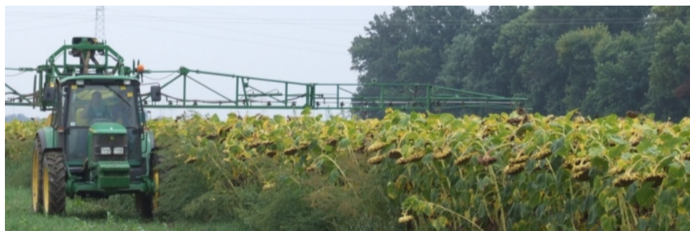
Sl. 3. Nošena prskalica John Deere 512 u radu

Norma tretiranja iznosila je 300 l/ha uz, iz ogleđa 2006, preporučenu dozu 2,5 l/ha kontaktnog herbicida „Reglon forte“ (a.m. dikvat). Radni pritisak je iznosio 5 bar, a brzina kretanja 9 km/h. Rasprskivači su bili montrani na prskalicu John Deere 512, zapremine reervoara 1200 litara i radnog zhvta 18 metara, slika 3.