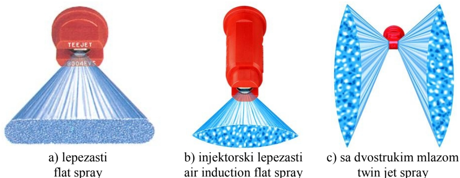
Sl. 1 Rasprskivači koji se koriste za desikaciju Fig. 1 Nozzles for desiccation

Efikasna desikacija suncokreta primenom klasičnih prskalica moguća je samo pravilnim izborom rasprskivača. U zavisnosti od stanja useva, zakorovljenosti i vremenskih uslova moguće je izbor rasprskivača prikazanih na slici 1.