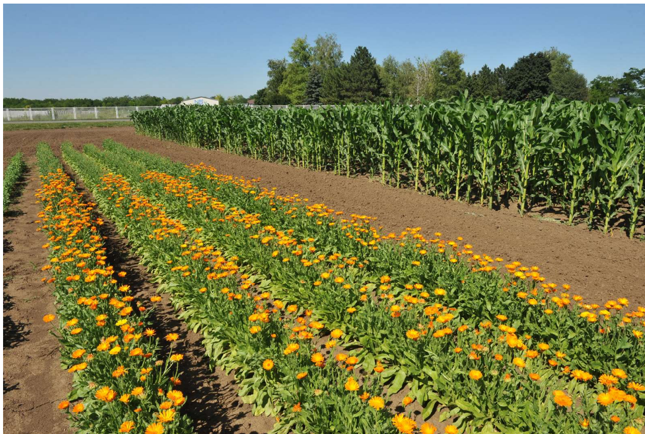
Sl. 1 Ogledno polje Odeljenja za organsku proizvodnju i biodiverzitet, Instituta za ratarstvo i povrtarstvo Novi Sad (orig.)

U radu je izvršena analiza dinamike trenutne vlažnosti zemljišta u periodu jun–kraj vegetacije u usevu nevena, mente i bosiljka gajenih u dva načina proizvodnje: konvencionalna i organska. Eksperiment je izveden na oglednom polju Odeljenja za organsku proizvodnju i biodiverzitet, Instituta za ratarstvo i povrtarstvo Novi Sad (Sl. 1).