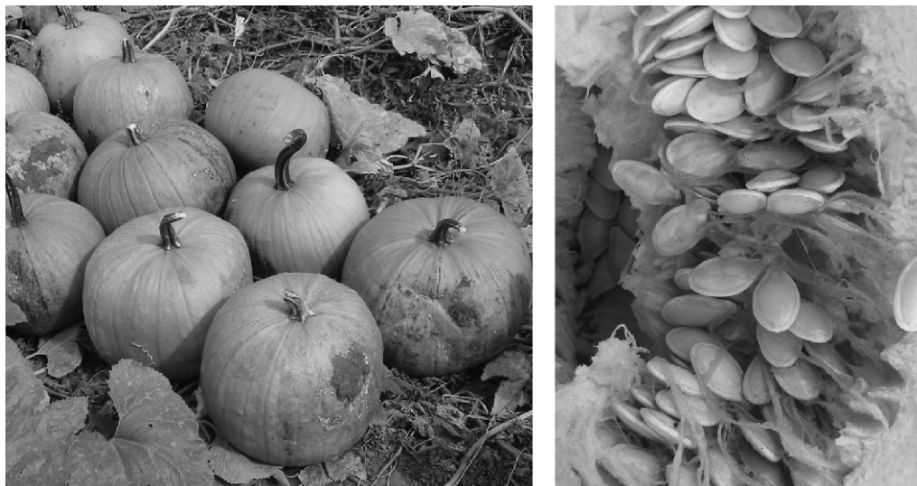
Sl. 1 Plodovi uljane tikve sa ljuskom cv. Olivija Fig. 1 Fruits of hulled seeded oil pumpkin cultivar Olivija