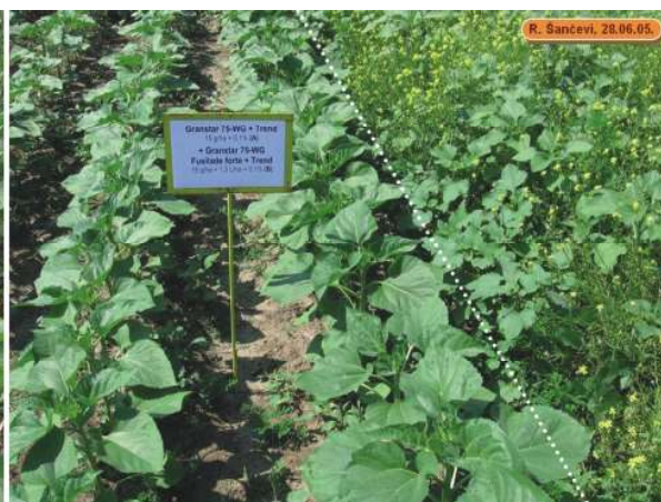
Sl. 2. Efekat dvokratne primene preparata Granstar 75-WG na S. arvensis , D. stramonium i X. strumarium u suncokretu tolerantnom prema tribenuron-metilu

Ekonomski značaj palamide i njeno povećano prisustvo na poljima pod suncokretom i drugim usevima u poslednjih nekoliko godina, najbolje ukazuju na potrebu uvođenja ovog sistema suzbijanja korova u Srbiji. Pored palamide, mogućnost efikasnog suzbijanja drugih širokolisnih korova ( Sinapis arvensis , Solanum nigrum ,