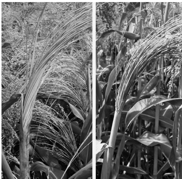
Sl. 2. Neeksponirana (levo) i ekspozirana metlica sirka metlaša (desno).