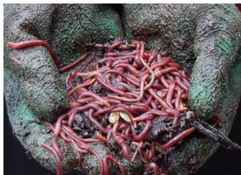
Leglo crvenih kalifornijskih glista

Prirodno stanište glista su deponije stajskog i biljnog dubreta. Na površinu gde se podiže leglo postavi se žičana mreža, zatim sloj starog papira ili kartona, a zatim se dodaje podloga. Kao podloga za uzgajanje glista mogu da se koriste uz prethodnu obradu goveđe, konjsko, svinjsko đubrivo kao i đubre od koza, ovaca i zečeva. Može da se koriste i karton, stari papir, lišće, piljevina,