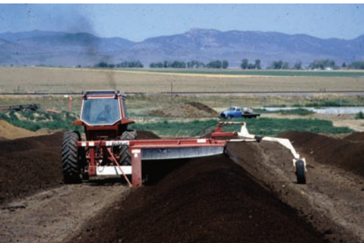
Mašina za mešanje (aeraciju) komposta

aktivnost zemljišta, obogaćuju ga hranjivim sastojcima i povećavaju otpornost biljaka na bolesti i štetočine. Kompost mora biti u direktnom dodiru sa zemljom da bi mikroorganizmi iz zemlje imali nesmetan pristup kompostištu. Tako se obezbeđuje oticanje suvišne vode i provetrenost kompostišta.