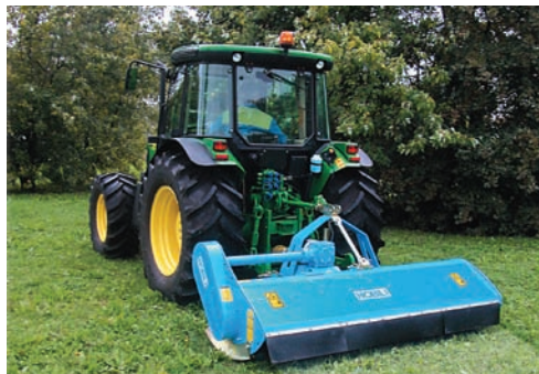
Malčera poljoprivredni-namenjen za malčiranje trave, žitnih i kukuruznih strništa, suncokreta i drugih kultura koje se koriste za zeleniše đubrenje

Malčiranje (nastiranje zemljišta) predstavlja pokrivanje međurednog prostora u usevima. Kao agrotehnička mera, izuzetno je značajna za rast i razvoj biljaka i zaštitu od korova. Veoma je korisna mera za očuvanje fizičkih i hemijskih osobina zemljišta. Malčiranjem se održava povoljniji vazdušni režim zemljišta, zadržava se i duži period čuva vlažnost zemljišta.