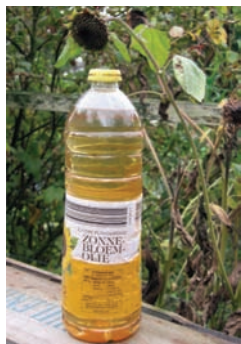
Suncokretovo ulje iz organske proizvodnje (Nemačka)

Danas se organska poljoprivreda u svetu razvija brzim koracima kao reakcija na sve izraženije narušenu životnu sredinu, pogoršanje kvaliteta hrane i sve većeg ugrožavanja zdravlja ljudi. Potrošnja organski proizvedene hrane, u razvijenim zemljama je u porastu, dok ponuda ne može da zadovolji rastuću tražnju. To otvara mogućnost zemljama sa nižim stepenom razvoja, gde u ruralnim područjima postoje optimalni ekološki uslovi, da povećaju proizvodnju organske hrane, a zatim je usmere na međunarodno tržište, gde bi mogli ostvariti višestruko veći profit u odnosu na izvoz konvencionalno proizvedene hrane. Pri tome treba znati da je cena proizvoda organske poljoprivrede veća nego iz konvencionalne proizvodnje za 25 do 30%.