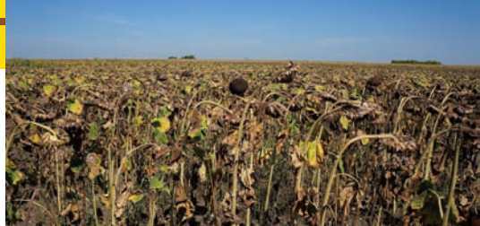
Hibrid "Duško" u organskoj proizvodnji kod Branka Kozića u Stajčevu

U organskoj proizvodnji osim kvaliteta, treba naročito obratiti pažnju na otpornost hibrida (sorti) prema bolestima, ekonomičnost u usvajanju i iskorišćavanju N, P i K. Hibridi moraju biti prilagođeni klimatskim stresovima i otporni na bolest i štetočine. Seme mora da se proizvede u organskoj proizvodnji i bez zaprašivanja hemijskim sredstvima. Ne treba zanemariti ni procenu potrošačkih navika tržišta i očekivani finansijski rezultat tokom plasmana. Svakako bi trebalo voditi računa i o kupovnoj moći potrošača.