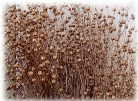
Slika 1. Čaure uljanog lana NS Primus