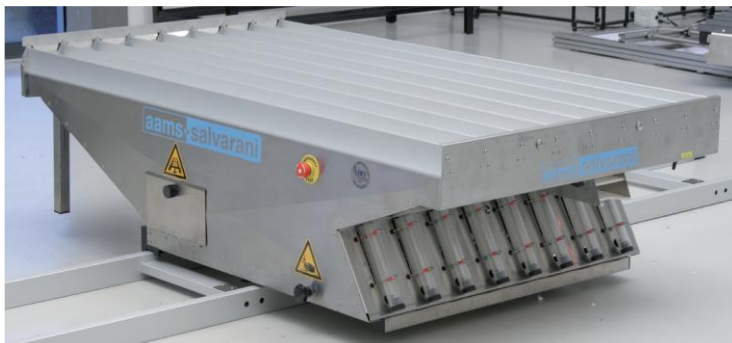
Slika 1: Horizontalni sprej skener

prskalice zamene), maksimalna radna širina iznosi 72 m ( AAMS-SALVARANI Merni instrumenti za ispitivanje mašina za zaštitu bilja ).