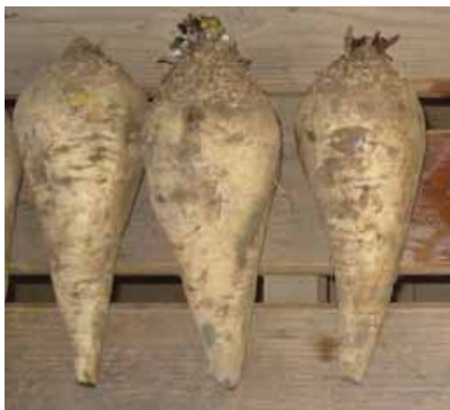
Slika 1. Genotip 12 Fig. 1. Genotype 12