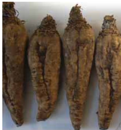
Slika 2. Genotip 4 Fig. 2. Genotype 4