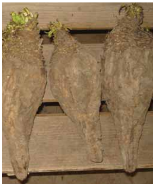
Slika 3. Genotip 17 Fig. 3. Genotype 17

od 2 do 7. U poređenju sa monogermnim, multigerminim genotipovima su iskazali veće variranje za ovo ispitivano svojstvo. Pošto većina roditeljskih linija nisu duboko u inbređingu, a posebno linije oprašivači (populacije), genetička varijabilnost se više pojavljuje kod hibrida šećerne repe nego kod hibridnog kukuruza, ili samooplodnih biljaka kao što su pšenica i soja (Panella & Lewellen 2007).