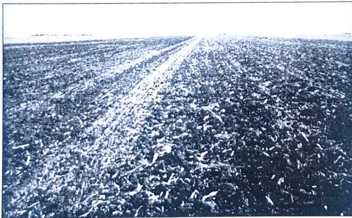
Sl. 1. Redukcija sklopa ozime pšenice usled otežanog nicanja i propadanje semena pšenice prouzrokovano gljivama iz roda Penicillium (Orig.)

Uvod. U jesen 2000. godine, bili su izuzetno nepovoljni uslovi za setvu ozimih strnina. Dug beskišni period otežavao je predsetvenu pripremu zemljišta, pa je u značajnom procentu došlo do setve u monokulturi (strnina na strninu), a zabeležene su i parcele na kojima je ponovljena setva iste sorte na istoj površini (sorta na sortu). Odluka da se ozima strna žita seju u monokulturi bila je neopravdana, pre svega zbog mogućnosti jače pojave bolesti i neizbežnog gubitka prinosa. Međutim, presudili su ekonomski činioci i nepovoljni uslovi za predsetvenu pripremu. Drugi predusevi (kukuruz, suncokret, soja i šećerna repa) bili su nepovoljni zbog žetvenih ostataka i tvrdoće zemljišta. Period setve bio je dug i trajao je od kraja septembra do sredine novembra 2000. godine. Zbog setve u suvo zemljište (bez vlage neophodne za početno klijanje i nicanje), preporučena je dublja setva da bi se sprečilo provokativno nicanje do koga bi moglo doći posle slabih kiša i neznatne količine vodenog taloga.