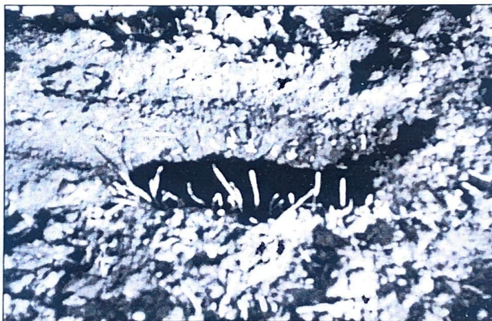
Sl. 3. Propadanje semena pšenice prouzrokovano gljivama Penicillium spp. na dubini setve (iza), ispred normalno nikle biljke (Orig.)

Simptomi propadanja semena ozime pšenice prouzrokovani gljivama iz roda Penicillium specifični su i lako prepoznatljivi. Na setvenoj dubini, u zemljištu, nalaze se neklijala i nabubrela zrna (sl. 3). Karakteristična zelenosiva micelija razvija se na embrionu zrna, ređe na bradici u vidu manjih ili većih gomilica. Ovo je sasvim očekivano jer je embrion najvredniji deo zrna po sadržaju hranljivih materija, pa samim tim i za ishranu gljive. Ponekad je celo zrno prekriveno i obraslo micelijom. Nasuprot tome, nalažena su i na izgled zdrava, neklijala zrna, iz kojih su takođe izolovane gljive iz roda Penicillium . Biljke koje su nicale sa veće dubine imale su deformisanu klicu i pojavu truljenja, iako nije bilo micelije na njihovoj površini. Na pojedinim biljčicama zapaženo je sušenje vrhova lista sa karakterističnom žutobraon bojom, da bi se izolacijom iz ovih biljčica potvrdilo prisustvo Penicillium -a.