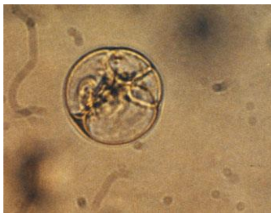
Slika 3. Asimetrična deoba produkata fuzije - Asymmetric division of fusion products

Prve deobe produkata fuzije stavljenih u kulturu agaroznih kapljica po metodi Wingender i sar. , 1996, bile su asimetrične. Dobijene su dve ćerke ćelije različite veličine (Slika 3). Druga deoba je bila deoba manje ćelije. Međutim ćelije se nisu dalje delile i nakon izvesnog vremena su nekrotirale.