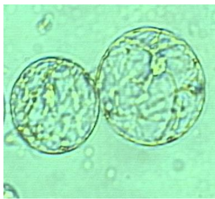
Slika 1. Protoplasti izolovani iz listova Helianthus maximiliani Protoplasts isolated from Helianthus maximiliani leaves