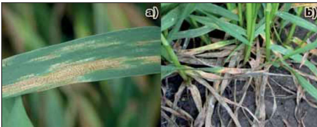
Slika 1. a) Siva pegavost lista pšenice (prouzrokovac Z. tritici ); b) Propadanje donjih listova pšenice usled jace pojave Z. tritici

prouzrokovane patogenom P. nodorum su uglavnom znatno sitnije od pega prouzrokovanih patogenom Z. tritici (Slika 1a). Bitno je istaci i da prisustvo piknida u okviru pega kod prouzrokovaca sive pegavosti lista i sive pegavosti plevica pšenice odvajaju pojavu ovih oboljenja od normalnog sušenja donjih listova, koji su završili svoju fiziološku funkciju (Slika 1b).